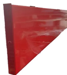
FIANCO PIEGATURA SINGOLO 1200*1500 H 200